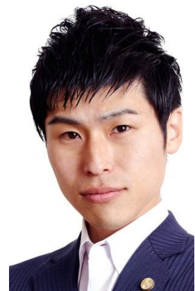
弁護士 参院東京 山添 拓