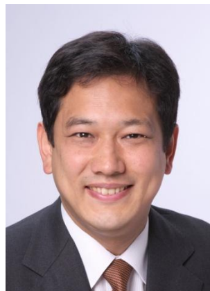
衆議院議員 宮本 徹