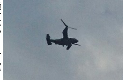
東村山市上空を飛行するオスプレイ (7月11日 夕方撮影)