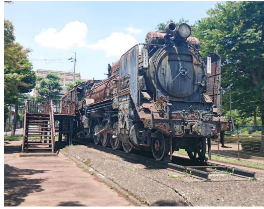
放置され激しく老朽化した 運動公園のSL(D51684号機)